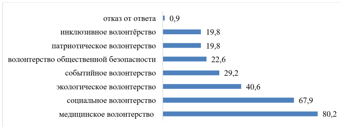
Рис. 2. Распределение ответов на вопрос «Какие виды волонтерской деятельности Вас также привлекают?» (каждый респондент мог выбрать не более 3 вариантов ответов, поэтому сумма больше 100%).

Наконец, показательны ответы респондентов на вопрос: «Какие виды волонтерской деятельности вас также привлекают?» (рис. 2).