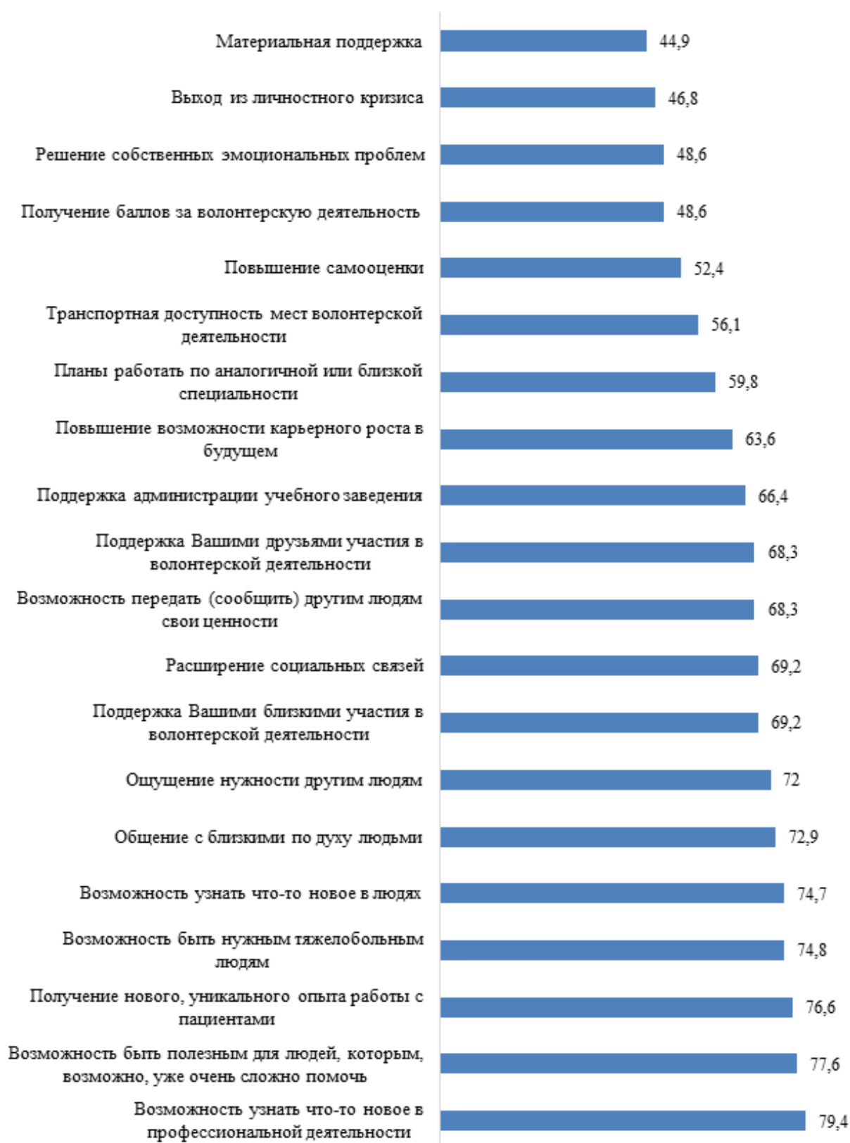
Рис. 5. Рейтинг факторов, влияющих на волонтерскую деятельность (в процентах к общему числу опрошенных); учтен выбор вариантов ответов ««скорее значимо» и «очень значимо»».