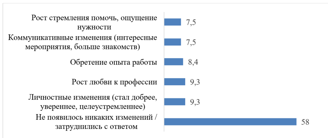
Рис. 4. Изменения в жизни респондентов от участия в волонтерском движении паллиативной помощи (в процентах к общему числу опрошенных).

В связи с этим показательно ответы на открытый вопрос «Какие еще существенные изменения в вашу жизнь привнесло участие в волонтерском движении паллиативной помощи?» (рис. 4).