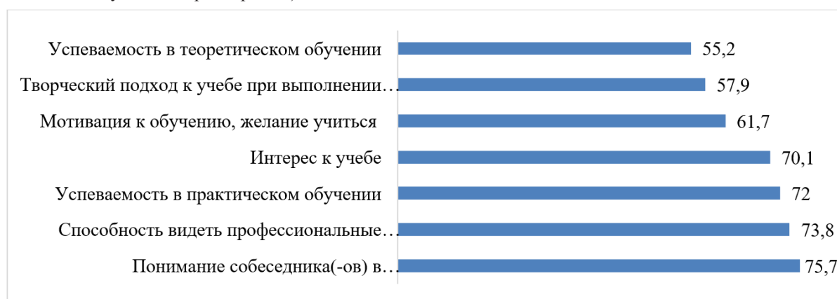
Рис. 3. Динамика позитивных оценок воздействия от участия в волонтерском движении (в процентах к общему числу опрошенных).

Каждый из параметров респондентам предлагалось оценить, выбрав одно из утверждений: «значительно снизилось»; «снизилось»; «не изменилось»; «повысилось»; «значительно повысилось». Рейтинг утверждений, связанных с динамикой позитивных оценок воздействия и с выбором вариантов ответов «значительно повысилось» и «повысилось», представлен на рис. 3.